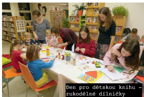
Den pro dětskou knihu - rukodělné dílničky

Den pro dětskou knihu jsme oslavili tvořivou dílničkou, kde jsme vyráběli závěsné andělíčky, vánoční skřítky a trénovali záložky před vyhlášením soutěže O nejlepší dětskou záložku. Na závěr dne si pro nás žáci dramatického oboru ZUŠ Blansko připravili scénické čtení z Deníku malého poseroutky. Vybrali si úvodní pasáž a tematicky část o Vánocích. (Scénické čtení je atraktivní spojení literatury a divadelního