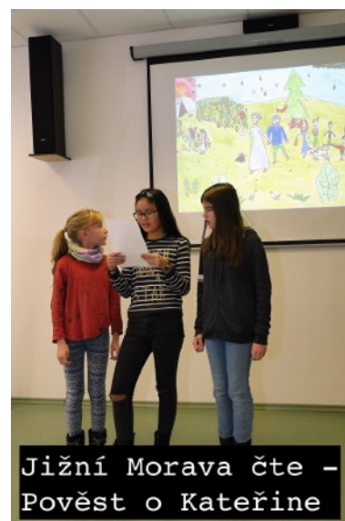
Jižní Morava čte - Pověst o Kateřině

Den pro dětskou knihu jsme oslavili tvořivou dílničkou, kde jsme vyráběli závěsné andělíčky, vánoční skřítky a trénovali záložky před vyhlášením soutěže O nejlepší dětskou záložku. Na závěr dne si pro nás žáci dramatického oboru ZUŠ Blansko připravili scénické čtení z Deníku malého poseroutky. Vybrali si úvodní pasáž a tematicky část o Vánocích. (Scénické čtení je atraktivní spojení literatury a divadelního