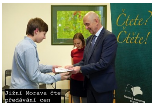
Jižní Morava čte předávání cen